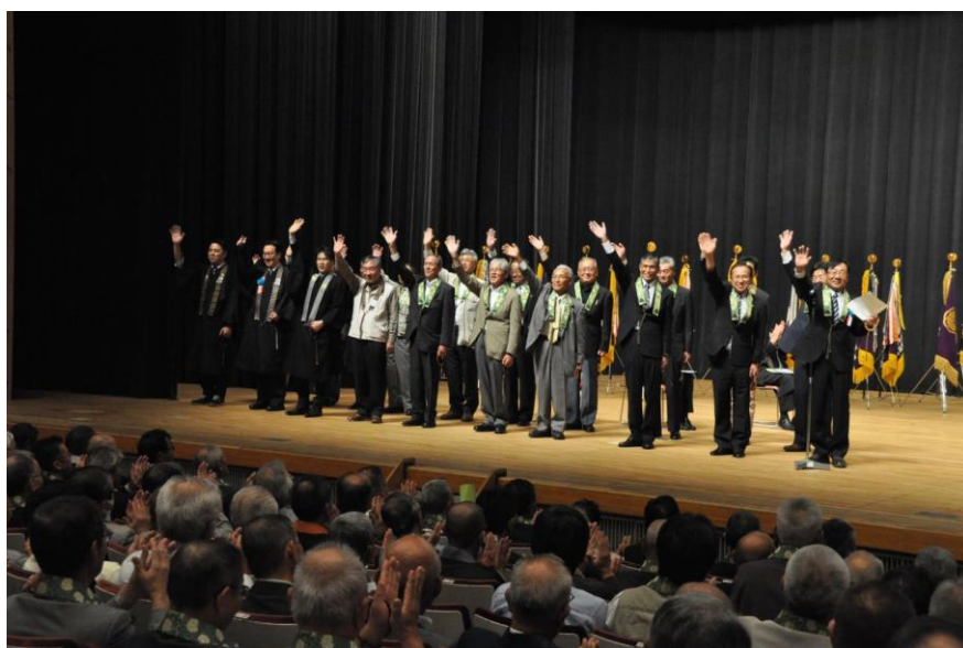
閉会式では次回担当の備後教区の皆さんが登壇、大会をアピール。

なお次回開催は、平成32年度備後教区です。また全国の仏教壮年の仲間とお会い出来ることを楽しみに3年後を迎えましょう。