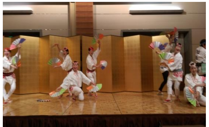
熊本地震での支援の御礼に、熊本教区の仏壮会員による「ちょんかけコマ」(左)と、「仙台のすずめ踊り」(右)が披露されました。

寺院数そのものが数少ない東北の地での大会で、何かとご不便をおかけしたと思いますが、準備の段階から全国から仏壮の仲間がかけつけてくれ、東北のスタッフとともに会場の後片付けにまで汗を流してくれました。そのおかげでなんとか皆様をお迎えすることができました。